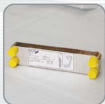
高效率板式冷熱交換器 High efficiency SWEP heat exchanger