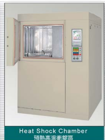
Heat Shock Chamber 預熱高溫衝擊區