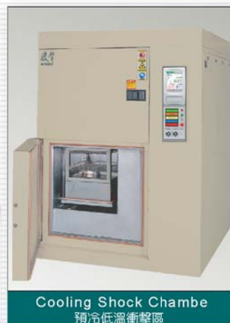
Cooling Shock Chamber 預冷低溫衝擊區