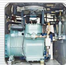
半密閉式大型壓縮機組 Semi-Hermetical professional compressors