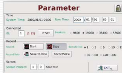
系統設定 System hypothesis

The wet ball temperature of the universe shows