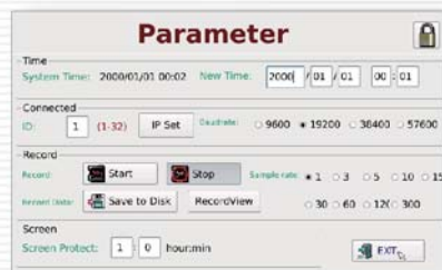
系統設定 System hypothesis